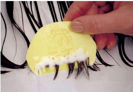
Poux de tête